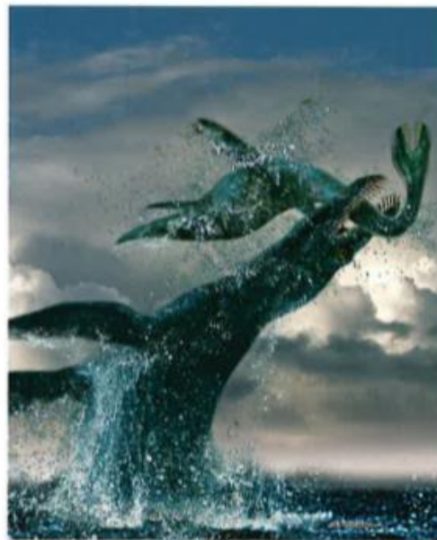
Pliosaurus fanger svaneøgle.

Forskere som studerer dinosaurer, har funnet rester etter tusen forskjellige arter.