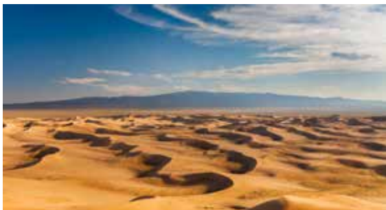
Gobi-ørkenen 戈壁 Gēbì dekker store deler av Nord-Kina og strekker seg langt inn i Mongolia. ID 73366386 © Anton Petrus | Dreamstime.com