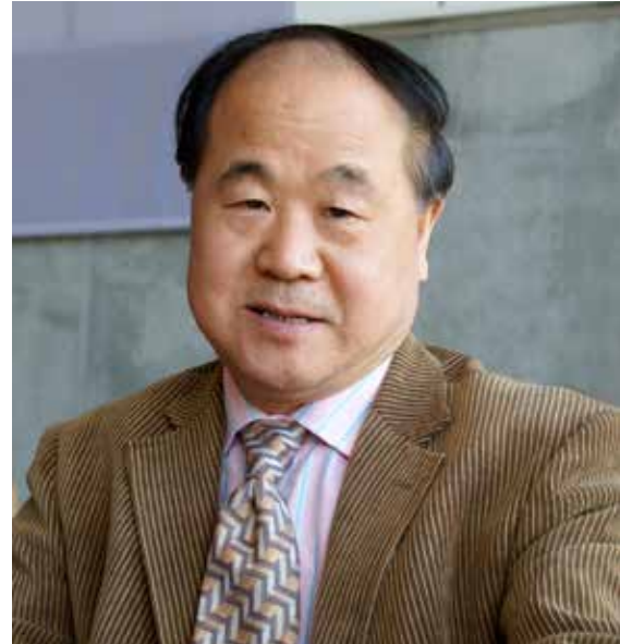
Mo Yan 莫言 Mò Yán er en av nåtidens mest kjente kinesiske forfattere. Han vant nobelprisen i litteratur i 2012.