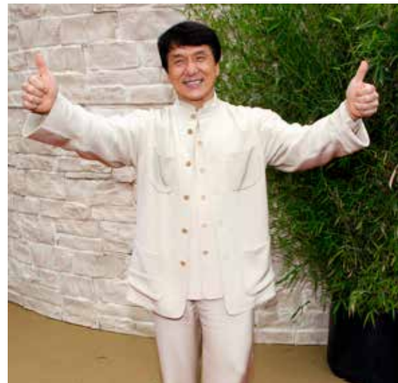
Jackie Chan 成龍 Chéng Lóng, en av nåtidens mest kjente kinesiske skuespillere, har spilt i utallige kung-fu-filmer.

Det kinesiske musikk- og filmmarkedet er et av verdens største, og kinesere er like opptatt av musikk og film som deg og meg. Den moderne kinesiske musikk- og filmindustrien begynte ikke å vokse før i 90-årene, men de siste årene er stadig flere skuespillere og filmer fra Kina blitt kjente i resten av verden også. Tradisjonelt var kung-fu-filmer den mest populære sjangeren, og de første kinesiske filmstjernene spilte i slike filmer. Sjangeren er fortsatt populær, men Kina lager filmer i mange andre sjangere også – og alle slags typer musikk.