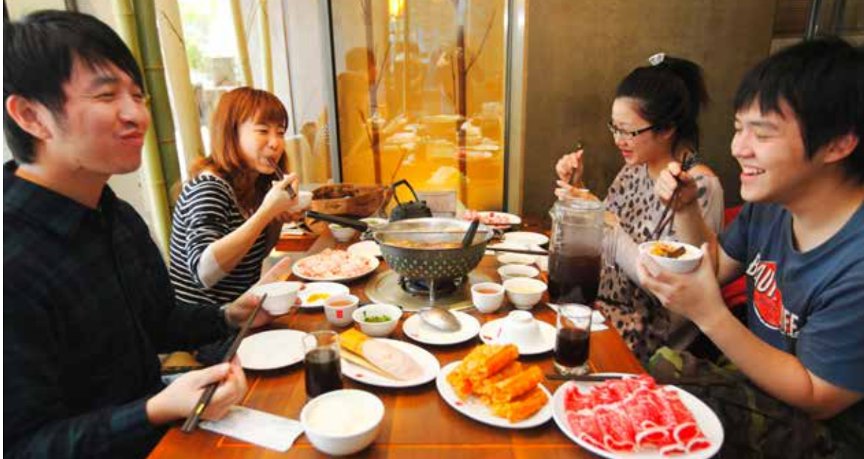
Hot pot 火锅 Huǒguō er veldig sosialt og populært i hele Kina. Kokeplata med forskjellige gryter og typer kraft står midt på bordet, og gjestene bestemmer selv hva som skal oppi gryta.

Kineserne er veldig opptatt av mat og drikke, og de er stolte av sin egen mattradisjon. Når kinesere skal småprate, prater de ikke om været som oss nordmenn, de prater om mat! Det kan være vanskelig å definere hva som er typisk kinesisk mat, men det er mye lettere med drikke. Teen