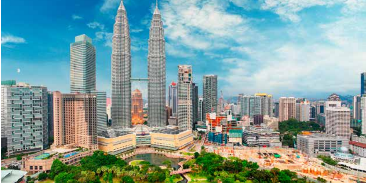
Kuala Lumpur 吉隆坡 Jílóngpō er hovedstaden i Malaysia. Malaysia har kinesisk som ett av sine offisielle språk og har en stor andel innbyggere med kinesisk bakgrunn.