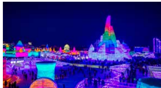
Harbin 哈尔滨 Hā'ěrbīn i Nord-Kina er verdenskjent for den årlige is-skulpturfestivalen. I Harbin er det ofte helt ned i -30 grader om vinteren og dermed perfekte forhold for is-skulpturer. Alle bygningene på bildet er laget av is! Om våren smelter de, og neste år bygger man nye. ID 93922475 © Pablo Hidalgo | Dreamstime.com