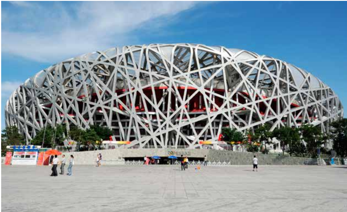
«Fugleredet» i Beijing var sentrum for OL i 2008. Det har plass til 80 000 tilskuere og er et av Kinas moderne ikoner.

terrakottahæren og Den forbudte by. Men det er også mange eksempler på moderne kinesisk kultur som er blitt verdenskjent. Kina er så stort og har en så lang og variert historie at uansett hva du er interessert i, vil du finne det i Kina!