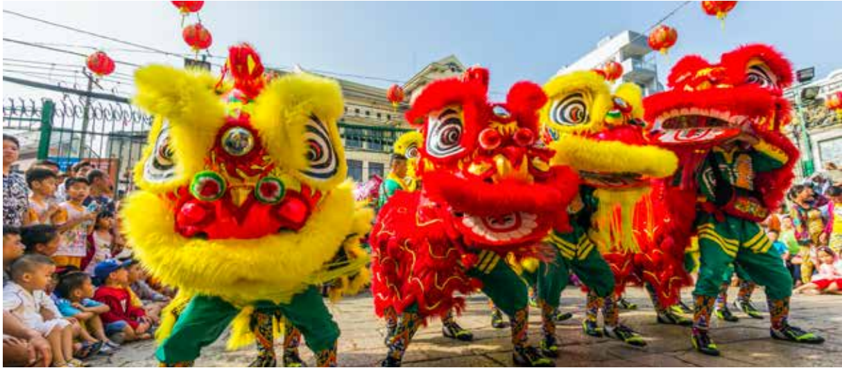
Dragedans har lange tradisjoner i Kina, og dragen er et viktig symbol i øst-asiatiske kulturer. Den kinesiske dragen er annerledes enn den vestlige dragen. Dette bildet er fra Ho Chi Minh City i Vietnam.