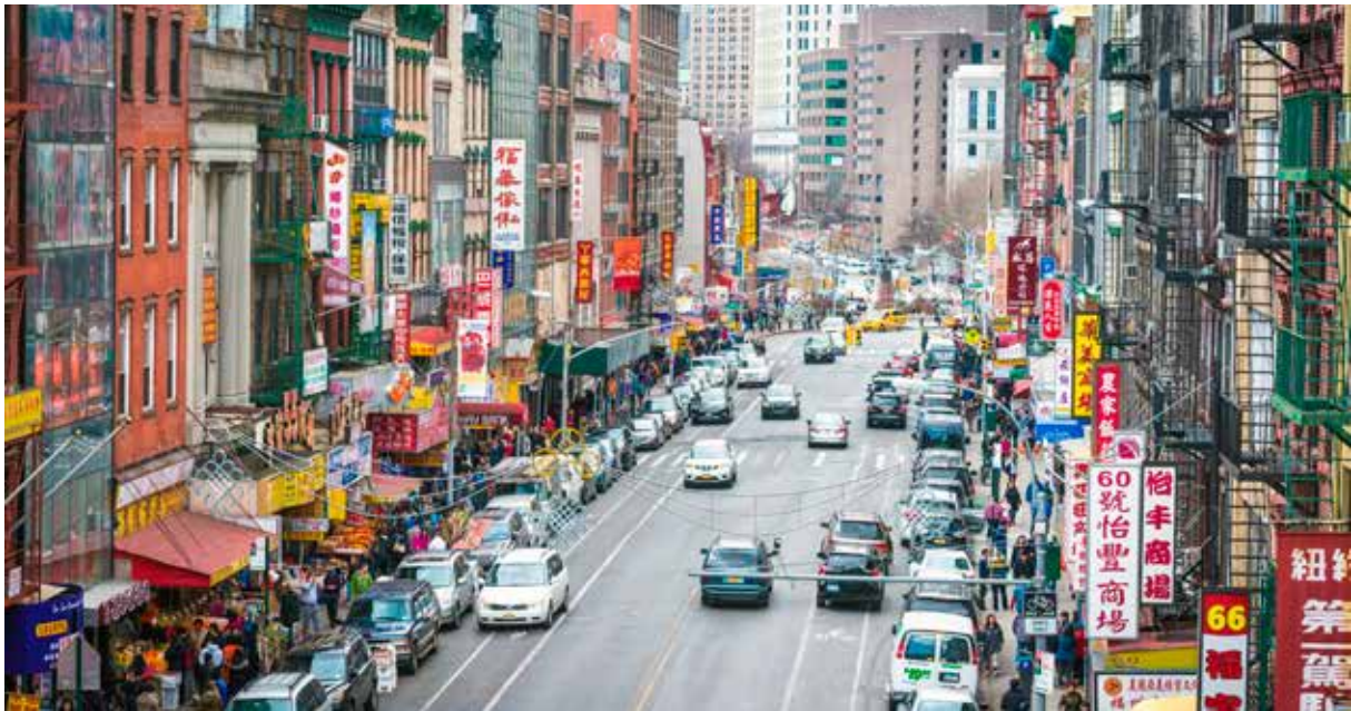
Mange byer rundt om i verden har en kinesisk bydel, en «chintown». En av de største er Chinatown i New York, 纽约 Niūyüē. Der bor det over 150 000 personer med kinesisk bakgrunn.