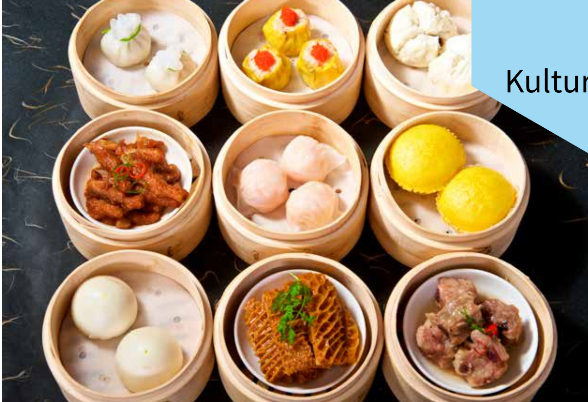
Dim Sum 點心 Diǎnxīn, de dampede smårettene fra Sør-Kina, er populære over hele verden. ID 60788544 © Tangducminh | Dreamstime.com

Kina er multikulturelt land, med 56 forskjellige etniske grupper, og har en flere tusen år gammel historie. De tidligste skriftlige historiske kildene vi kjenner til, er fra 1250 f.Kr., men mange mener at Kinas historie og de kinesiske dynastiene går hele 5000 år tilbake tid! Landet, grensene og kulturen har forandret seg utallige ganger, noe som gjør at Kina har en av verdens rikeste og mest varierte kulturarver.