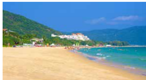
海南 Hǎinán-provinsen helt sør i Kina er kinesernes tropiske paradís og ligger like langt sør som Thailand, India og Hawaii.

kinesisk, åpner du dørene til hele Kina – og til en veldig stor del av verden. Kina er nemlig ikke bare et land. Kina er så stort og mangfoldig at det på mange måter kan sammenlignes med et kontinent. Kina er dobbelt så stort som EU, like stort som hele Europa, og det er dobbelt så mange kinesere som europeere!