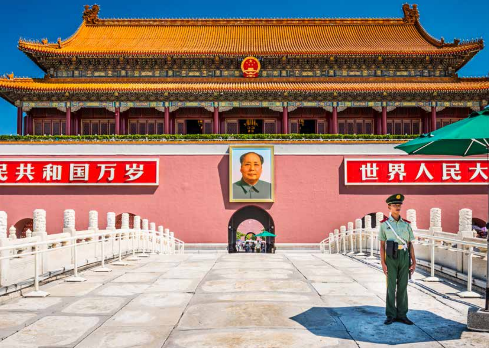
Det gigantiske portrettet av Máo Zédōng henger fortsatt over inngangen til Den forbudte by midt i Beijing. Mange forbinder fortsatt Kina med kommunisme og Máo Zédōng, men det er veldig lite i dagens Kina som ligner på det landet som Máo styrte.