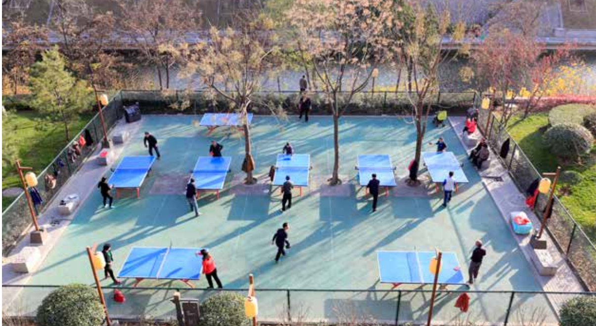
De aller fleste parker i Kina har bordtennisbord, og du finner alltid noen å spille med.