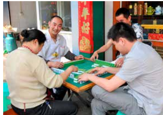
Mahjong 麻将 Májàng er et svært populært brettspill overalt i hele Kina. ID 24183577 © Lei Xu | Dreamstime.com