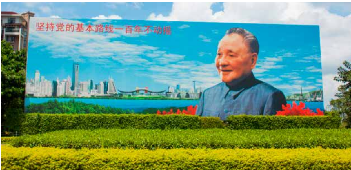
Dèng Xiǎopíng tok over etter Máo døde, og han regnes som den som åpnet det moderne Kina for verden og startet den kinesiske økonomiske veksten.

Det som er sikkert, er at siden Dèng Xiǎopíng snakket om fargen på kattene, har Kinas økonomi vokst og vokst, og i dag er den verdens nest største.