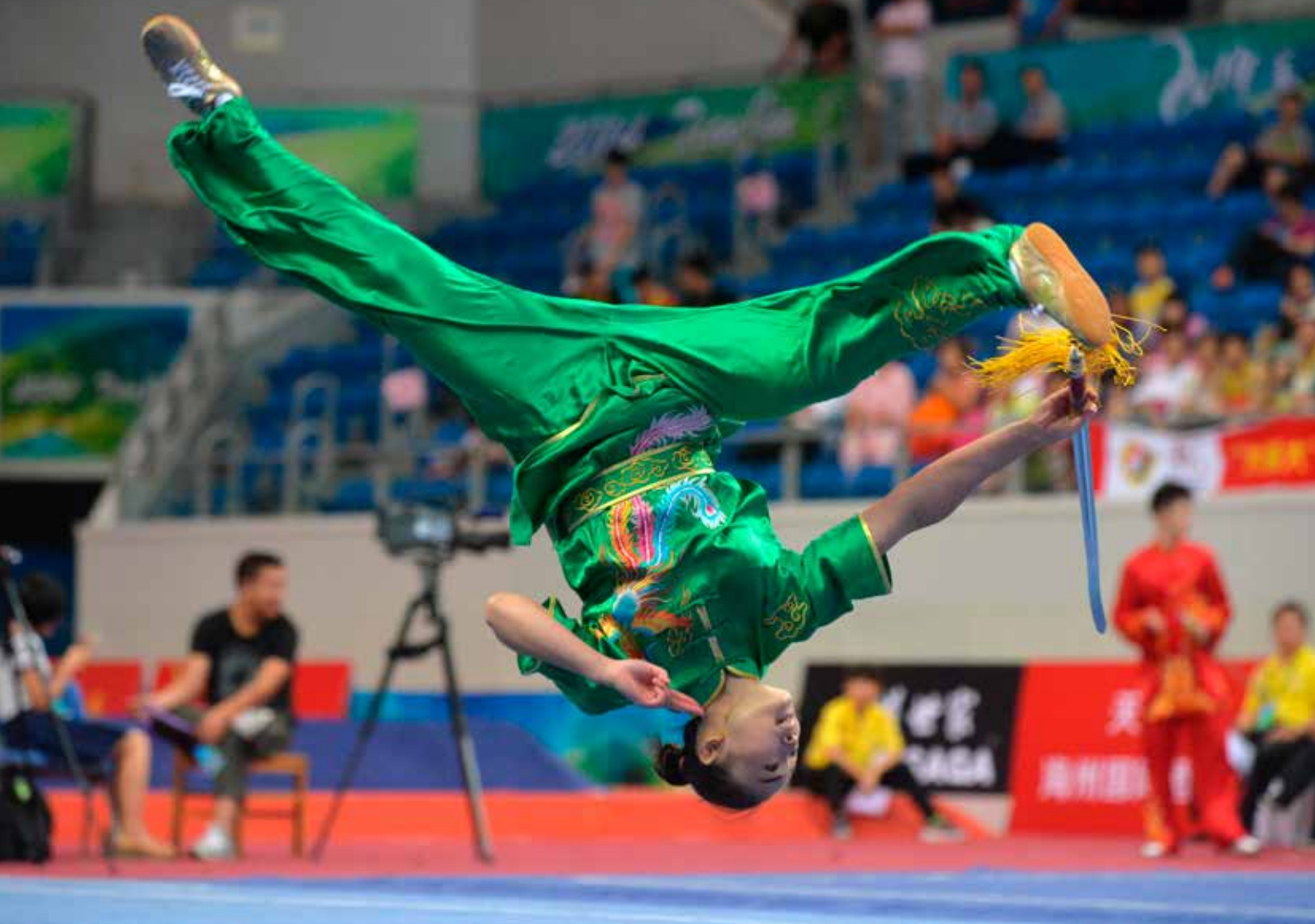
Akrobatisk wǔshù foran dommere i en konkurranse. ID 48756262 © Meiyiwen | Dreamstime.com

Mange tenker fortsatt på kampsport, og spesielt kung-fu 功夫 gōngfū, når det er snakk om sport i Kina. Wushu 武术 Wǔshù er sporten det konkurreres i, men det ligner like mye på