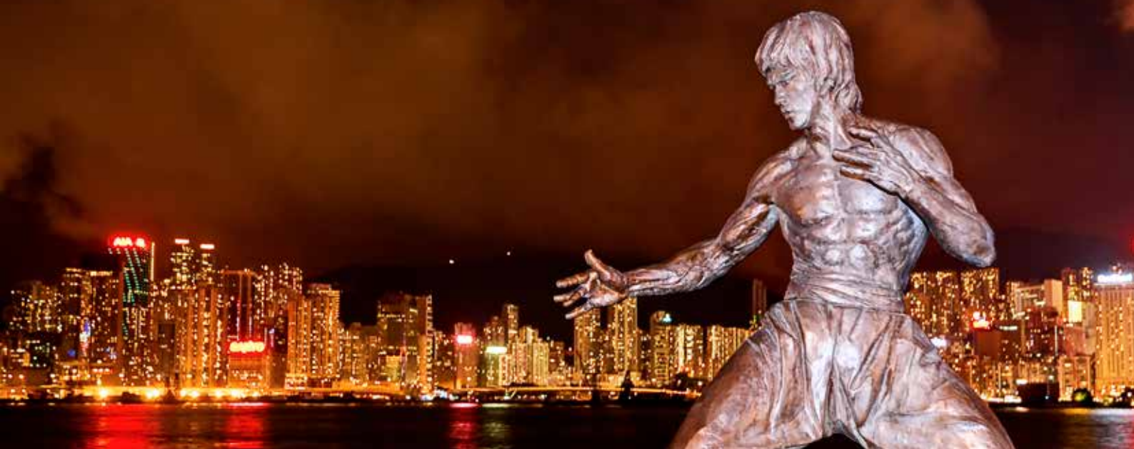
Bruce Lee 李小龍 Lǐ Xiǎolóng er en av verdens mest kjente skuespillere, og han var den som gjorde kampsport populært i Vesten. Her er en statue av ham i Hongkong.