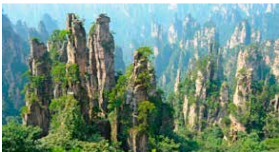
张家界 Zhāngjiājìè i 湖南 Húnán-provinsen midt i Kina med sine spesielle kalksteinsfjell.

Det å kunne et fremmedspråk er en stor ressurs, uansett hvilket fremmedspråk det er. Når du skal lære deg et fremmedspråk, betyr ikke det nødvendigvis at du vil lære å snakke språket flytende. Men selv om du bare kan litt, vil det åpne mange dører for deg. Hvis du lærer deg litt