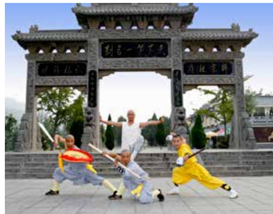
Shaolin-munkene er buddhistiske munkere som også trener kung-fu. De har inspirert til mange filmer og tv-serier.

Kina arrangerte sommer-OL i Beijing i 2008, og Beijing ble også tildelt vinter-OL i 2022. De fleste internasjonale sportsgrener har som regel flere kinesere i verdensstoppen. Tradisjonelt har Kina, sammen med USA og Russland, vært en av nasjonene som har vunnet flest medaljer i sommer-OL, men kineserne satser også stadig mer på vintersport.