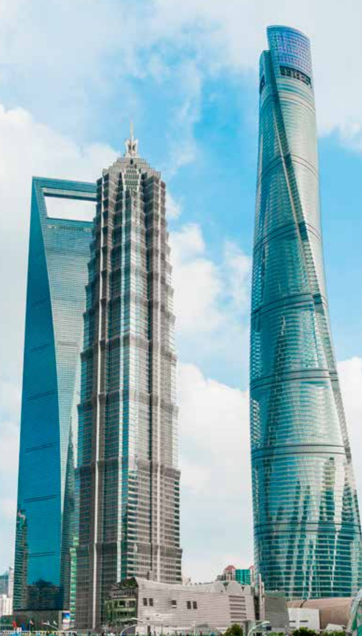
Shanghai Tower er med sine 632 meter og 128 etasjer verdens nest høyeste bygning.