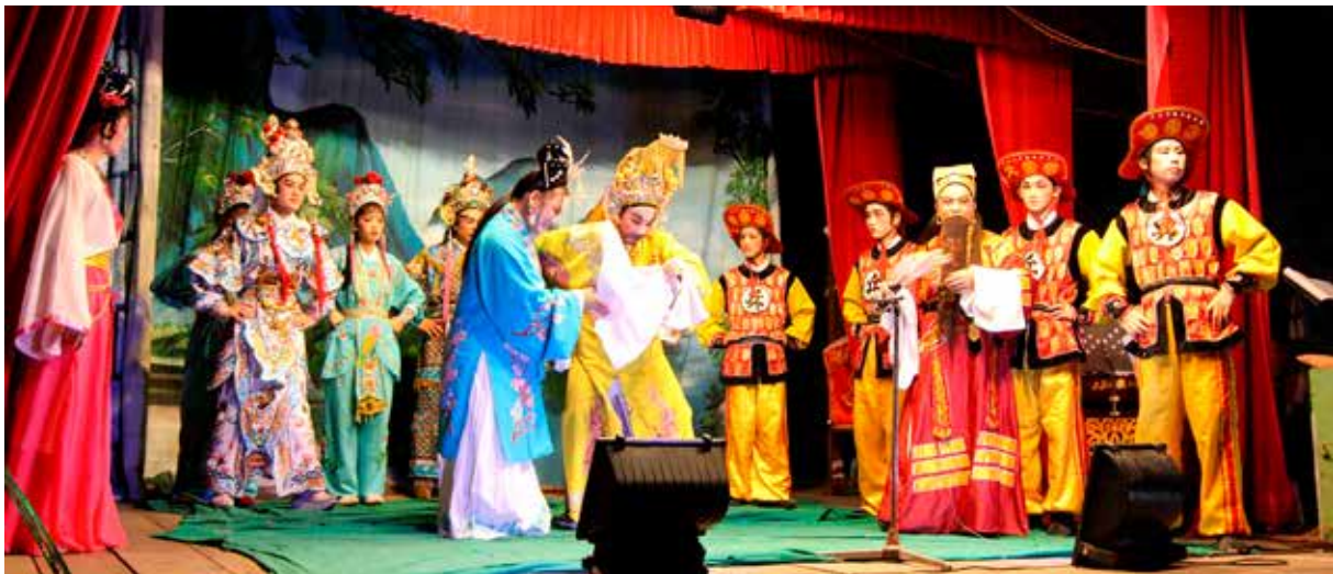
Kinesisk opera finnes i mange stilarter. Den er en av de klassiske kulturformene fra Kina og er kjent for ekstravagante kostymer og kunstferdig sminke.