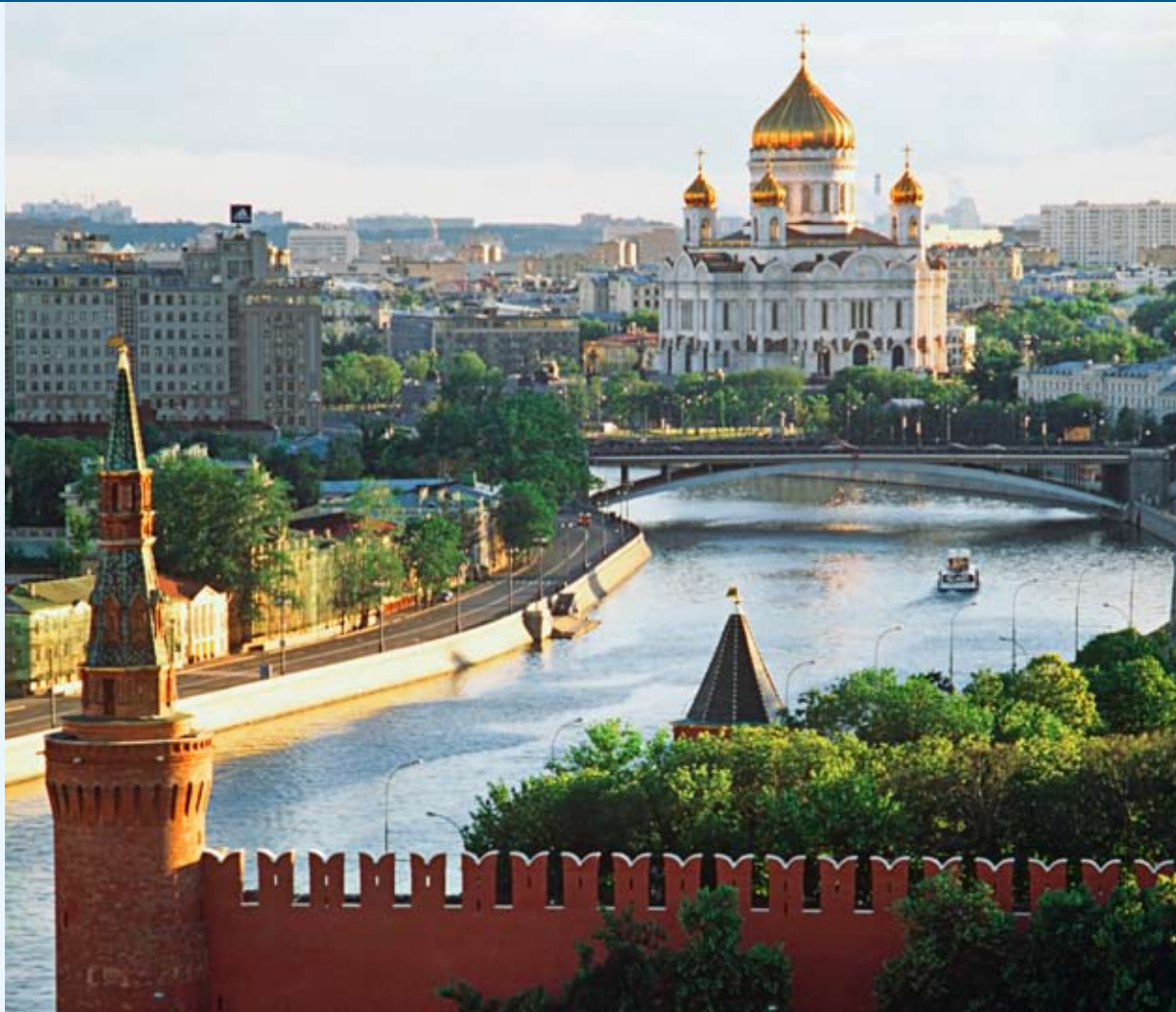
Moskva. Utsikt til Kristus Frelserens katedral og Moskva-elva.