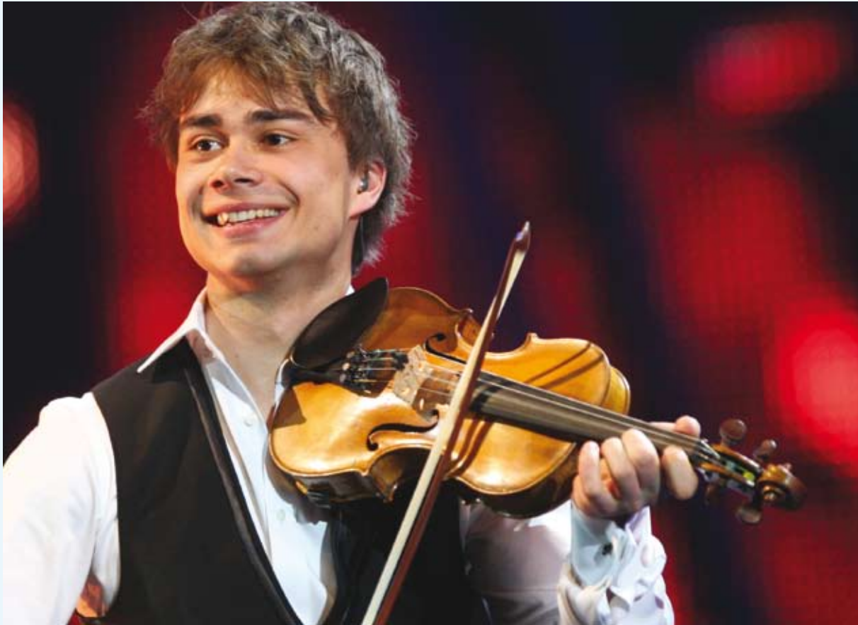
Alexander Rybak vant Eurovision Song Contest 2009 i Moskva. Han har røtter i Hviterussland og snakker selv russisk.