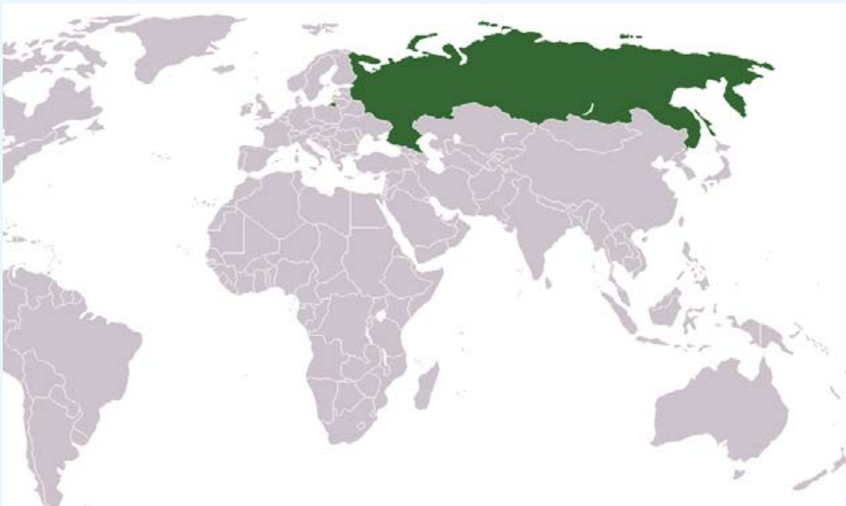
Russland i verden.

Den dag i dag omtales Norge (Норвегия /Narvjégija/) ofte som страна викингов /straná víkingaff/ 'vikingenes land'. Andre lett gjenkjennelige russiske «kallenavn» på Norge er for øvrig страна троллей /straná trólllej/ 'trollenes land' og страна фьордов /straná fjórdaff/ 'fjordenes land'.