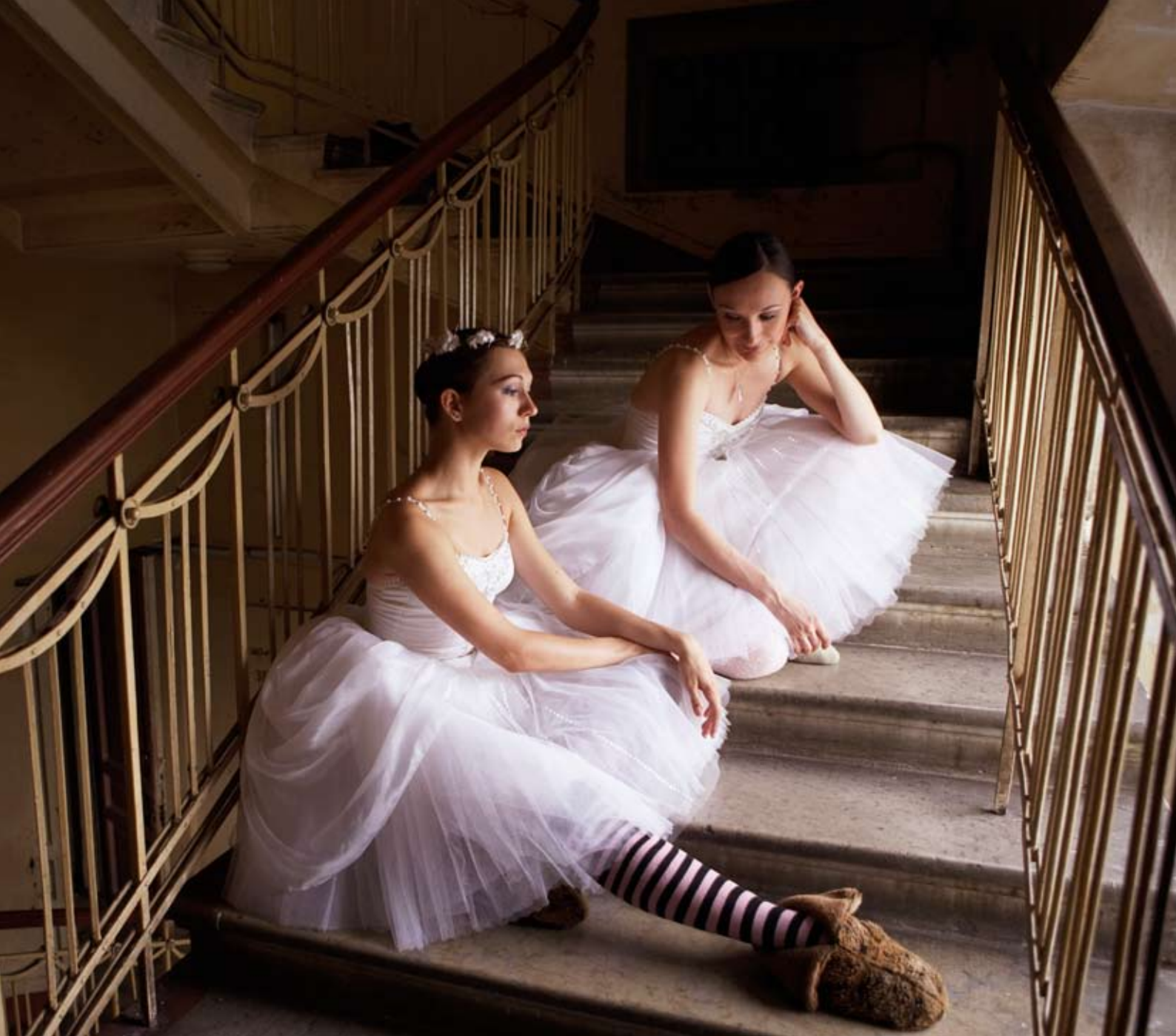
Ballerinaer i trapp.