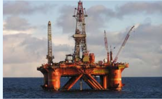
Norskeid borerigg på Sjtokman-feltet (Штокманское месторождение) i Barentshavet.

Men handelsvirksomheten mellom Norge og Russland foregår ikke bare gjennom store internasjonale selskaper. Russerne er klare for «bizniss» (бизнес) på alle nivåer. I 1992 ble det opprettet et russisk generalkonsulat i Kirkenes og et tilsvarende norsk konsulat i Murmansk for å ta hånd om all utvekslingen i Barentsregionen (nordområdene).