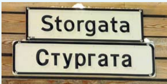
Gateskilt med norske og kyrilliske bokstaver i Storgata i Kirkenes.

En del russere bosetter seg for godt i Norge, og det er nå omlag 14 000 russiske innvandrere bosatt i Norge (tall fra Statistisk sentralbyrå fra 2009). Dette tallet vokser stadig – av flere grunner. Mange unge russere kommer til Norge for å studere, og mange norske menn gifter seg med russiske kvinner. Faktisk er det dobbelt så mange russiske kvinner som menn bosatt i Norge, og over 90 % av russerne har kommet til sitt nye hjemland i løpet av de siste 10 årene. Det var altså praktisk talt ingen russisk minoritet i Norge under Sovjetunionen og den kalde krigen. Russere som har slått rot i Norge, har dannet ulike foreninger der også nordmenn kan bli kjent med russisk kultur og russisk språk. I Oslo finnes det to slike russisk-norske klubber, og tilsvarende finnes også i andre større byer. Det russiske miljøet i Norge utgir dessuten bladet Соотечественник, Landsmannen , med mye stoff om russisk-norske forhold.