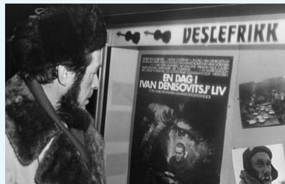
Solzjenitsyn på kino i Oslo for å se sin egen roman som film, En dag i Ivan Denisovitsj' liv.

En annen kjent russer, nobelprisvinneren i litteratur Aleksandr Solzjenitsyn (Александр Солженицын) (1918–2008), kunne ha havnet i norsk eksil. Gjennom sine beskrivelser av de sovjetiske fangeleirene (GULAG-systemet) ble Solzjenitsyn en av Sovjetunionens mest markante opposisjonelle, en såkalt dissident. Da han ble tvunget til å forlate landet, tok Aftenpostens russlandskjenner Per Egil Hegge med seg forfatteren til Norge. Solzjenitsyn valgte imidlertid til slutt å bosette seg i Sveits i 1974. To år senere reiste han videre til USA, og, endelig, i 1994 flyttet han tilbake til Russland.