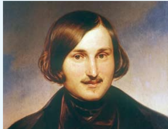
Forfatteren Nikolaj Vasiljevitsj Gogol Николай Васильевич Гоголь (1809–1852). Hans mest kjente verk er romanen Døde sjeler, novellene Kappen og Nesen og teaterstykket Revisoren.

Anna Karenina (en av de sterkeste kvinneskikkelsene i verdenslitteraturen). Tolstojs romaner inneholder alle ingredienser man finner i en god kioskroman eller slektsroman, men mangler klisjeene og borer mye dypere.