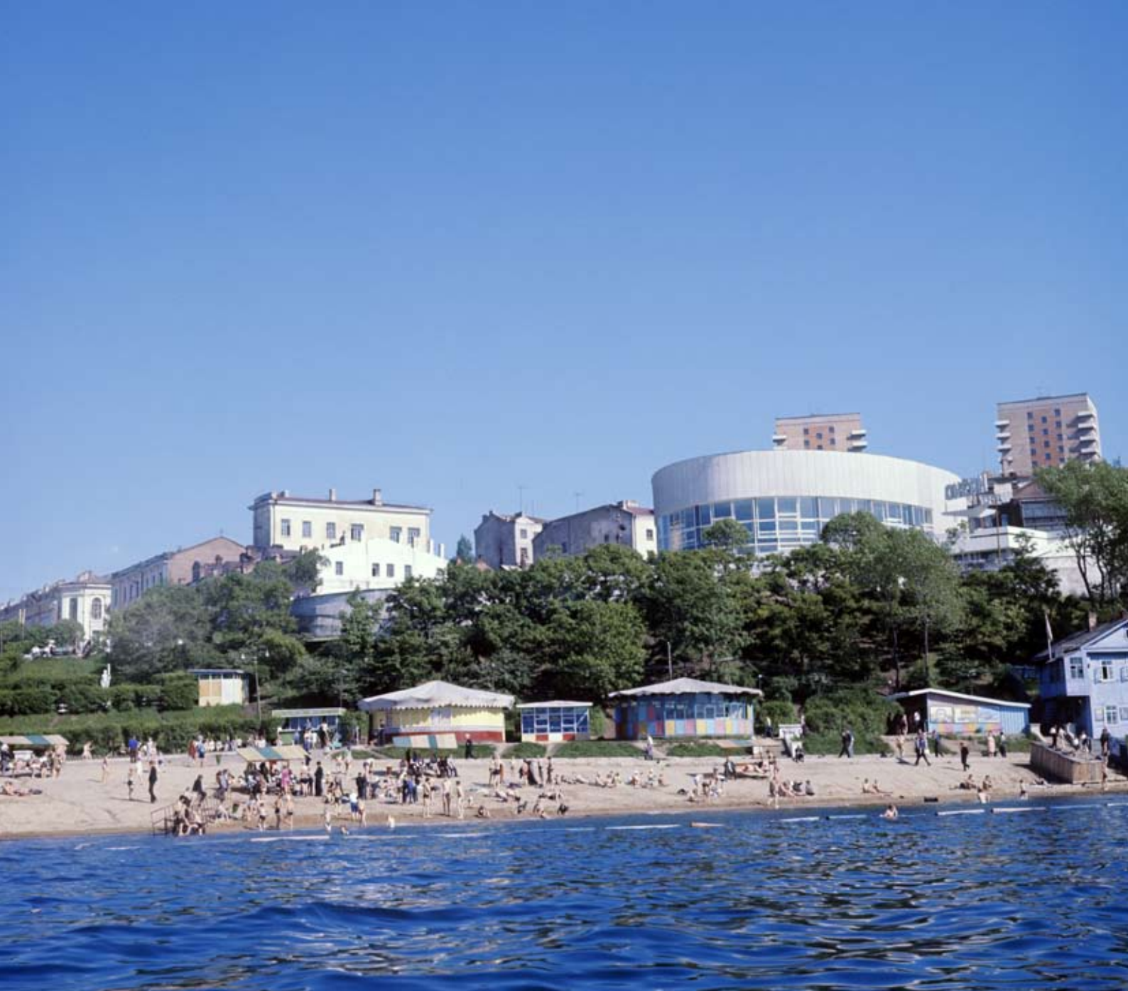
Stranden i Vladivostok. Vladivostok ligger ved Stillehavet lengst sørøst i Russland, rundt 6500 km øst for Moskva og bare 100 km fra grensa til Kina. Jernbanestasjonen i byen er endestasjon for den transsibiriske jernbanen.