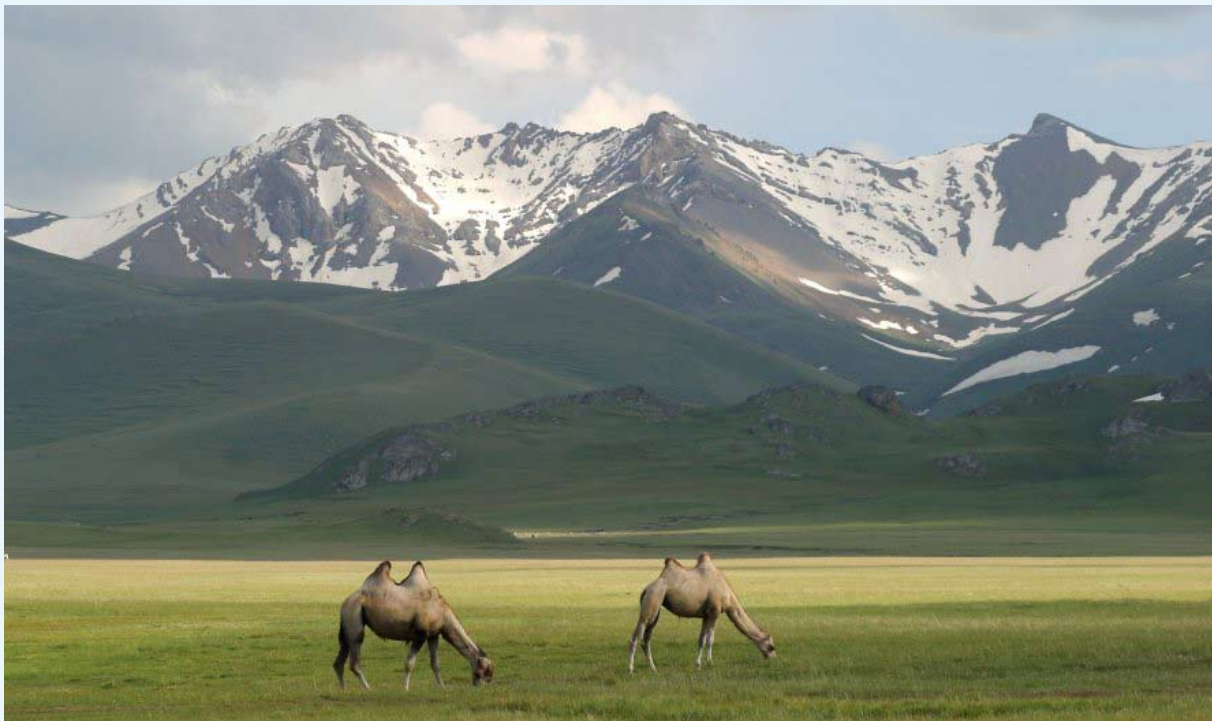
Kameler på en høyslette i Kirgisistan.

seg fra Østersjøen i vest til Stillehavet i øst, fra Nordishavet i nord til Svartehavet i sør. I dette enorme riket finner vi mange typer natur og klima. Som et bilde på størrelsen nevner vi at Russlands største innsjø, Bajkalsjøen sør i Sibir, er like lang som Sør-Norge, mens fjellkjeden Ural – som skiller vest og øst; det europeiske og asiatiske Russland – er like lang som Norge på langs. Mange filosofer trekker fram den «eurasiske» dobbeltheten når de prøver å forstå Russlands rolle i verden, den russiske identiteten. Men for at vi utenforstående nordmenn skal kunne forstå Russland, må vi først forstå språket.