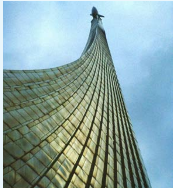
Kosmonautenes monument, Moskva. Kilde: davesag, http://www.flickr.com/photos/davesag/18839600/ Lisens: http://creativecommons.org/licenses/by-nc-sa/2.0/

I 1980-årene fortsatte denne undergrunnstradisjonen gjennom russisk rock – fremdeles med enkle arrangementer og gode tekster. Under Gorbatsjovs glasnost på slutten av 1980-årene ble rocken sluppet fri og oppnådde enorm popularitet. Flere av gruppene fikk kultstatus, slike som Аквариум og Кино (skjønner du hva navnene til disse to gruppene betyr?).