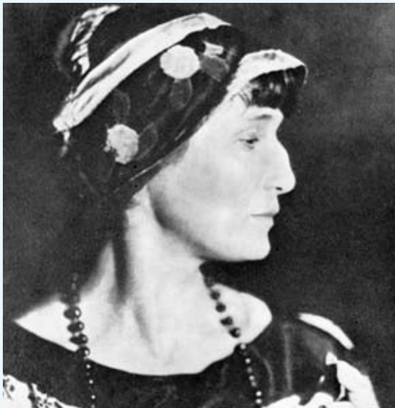
Poeten Anna Andrejevna Akhmatova Анна Андреевна Ахматова 1889–1966.

Et eksempel på en bok som er nesten uforståelig for utlendinger – selv med gode russiskkunnskaper – er Aleksandr Solzjenitsyns klassiker Один день Ивана Денисовича, En dag i Ivan Denisovitsj' liv . Solzjenitsyn skriver her om delvis selvopplevde hendelser fra de sovjetiske fangeleirene for opposisjonelle, med et språk fullt av den spesielle fangeleir-sjargongen som ble brukt i det miljøet.