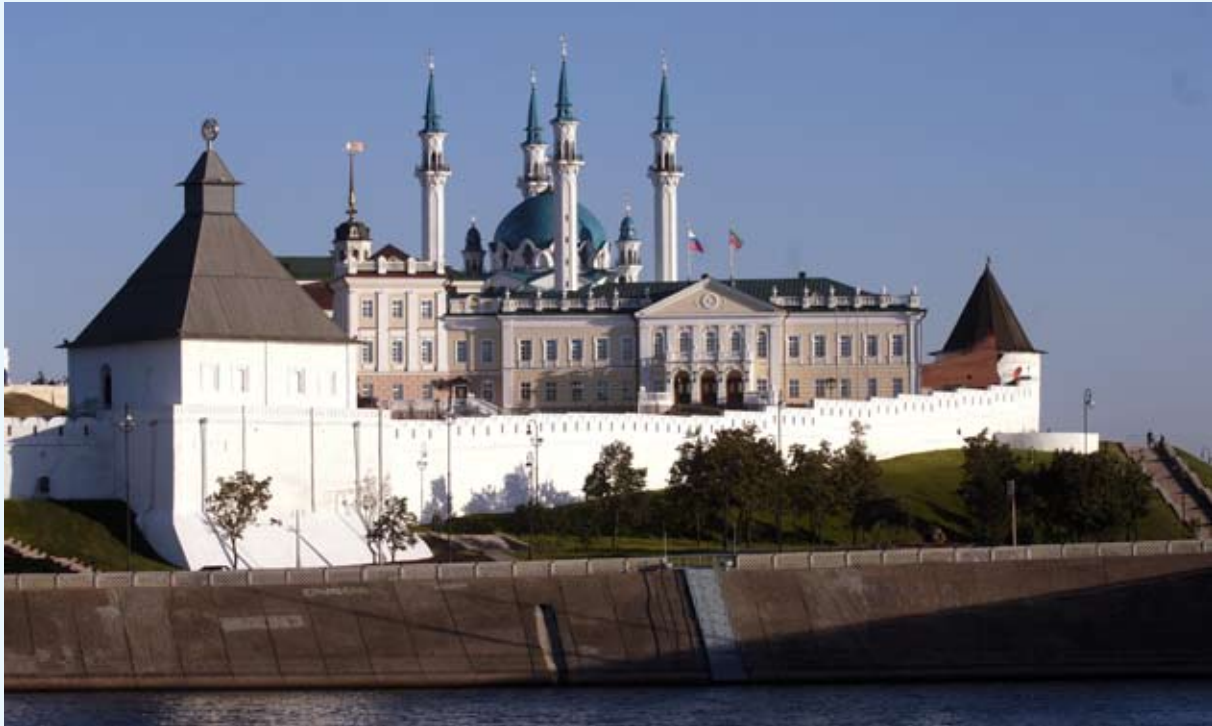
Kreml i Kazan. Utsikt fra Volga.

Når resultatet av verbhandlingen er viktig, må man på russisk bruke såkalt perfektiv aspekt. Ellers brukes stort sett imperfektiv aspekt. Når man på norsk sier «Helge leste ut boka», fokuserer taleren nettopp på det at handlingen ble avsluttet med et resultat, og man må oversette med perfektiv aspekt på russisk. I eksemplene 1–6 ovenfor kan også perfektiv aspekt brukes hvis det i konteksten er viktig for taleren å framheve resultatet.