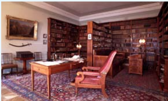
Pusjkins arbeidsrom. Pusjkin-museet i Sankt Petersburg.

Russerne har et helt spesielt forhold til poesi og diktning. Den største russiske forfatteren i deres øyne er ikke romanforfatteren Dostojevskij, men poeten Александр Пушкин (Aleksandr Pusjkin) (1799–1837). Den sterke poesitradisjonen kom senere også til uttrykk i kunsten til visesangere som Владимир Высоцкий (Vladimir Vysotskij), Булат Окуджава (Bulat Okudzjava) og Вероника Долина (Veronika Dolina). Kun utstyrt med en akustisk gitar og egenkomponerte viser oppnådde disse en enorm popularitet i det lukkede Sovjetunionen i 1960- og 70-årene.