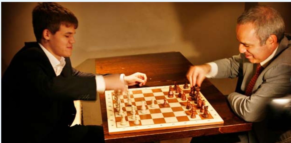
Samarbeidet mellom Norge og Russland har mange fasetter. I 2009 overtok den tidligere sjakkmasteren og politikeren Garri Kasparov rollen som trener for sjakkgeniet Magnus Carlsen.

Siden språkforskerne mener at russisk og norsk har et felles opphav, er det kanskje ikke så rart at det har vært en viss språklig påvirkning mellom disse nabolandene. Størst var nok denne påvirkningen i vikingtiden (800-tallet), da Ruslands maktsentrum lå i Kiev (hovedstaden i dagens Ukraina). Hit kom norske vikingkonger og satte varige spor, også i