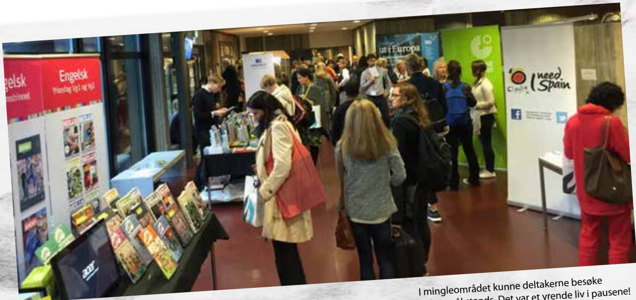
I mingleområdet kunne deltakerne besøke ulike språkstands. Det var et yrende liv i pausene!