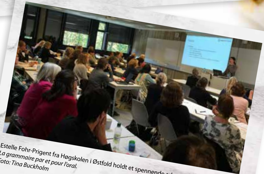
Estelle Fohr-Prigent fra Høgskolen i Østfold holdt et spennende arbeidsseminar om La grammaire par et pour l'oral .