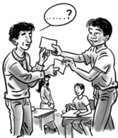
Figur: Quiz og bytt

samme spørsmål forekomme to ganger. Hver elev får en lapp med et spørsmål. Elevene reiser seg, går rundt i rommet og finner en medelev. De stiller hverandre sine spørsmål og avgir sine svar. Etterpå bytter de lapper, finner en ny medelev og gjentar prosedyren. Lærer går rundt og lytter til samtalen. Aktiviteten avsluttes når læreren mener at mange nok har fått snakket med hverandre.