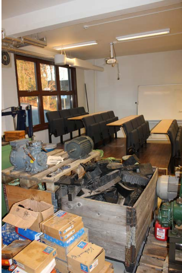
Auditoriet i verkstadhallen