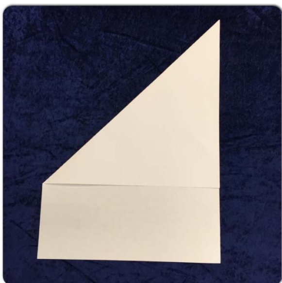
Brett eit A3 ark til ein trekant

La elevane lage si eiga utbrettshistorie for å beskrive ein miljøvennleg prosess. Med utgangspunkt i omgrepplakaten, byggjer eleven opp sin eigen ordbank, som han skal bruke til å lage historia. Eleven teiknar og skriv korte setningar på engelsk.