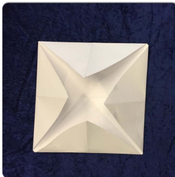
Slik skal han sjå ut til slutt.