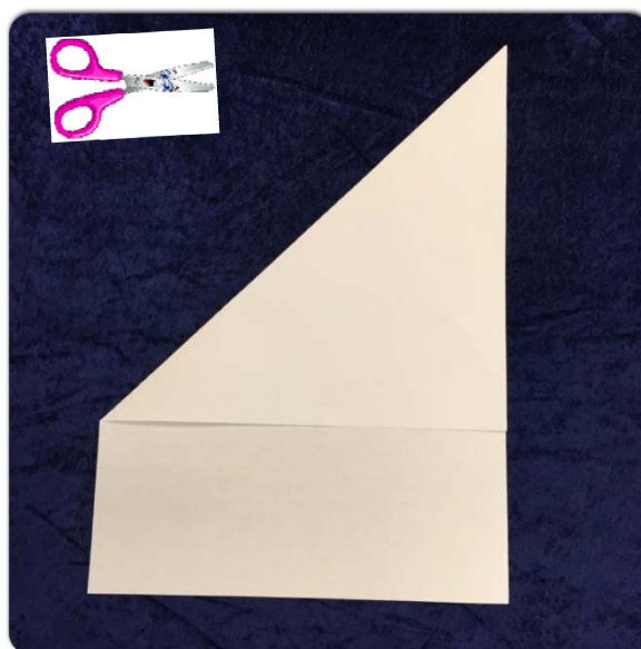
Klipp av slik at du får eit kvadrat når den verte bretta ut